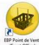
EBP Point de Vente (Front Office)