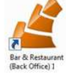
Bar & Restaurant (Back Office) I